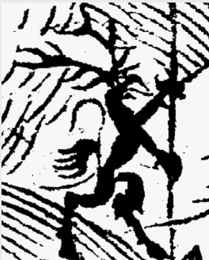
De oudst bekende afbeelding van Rübezahl